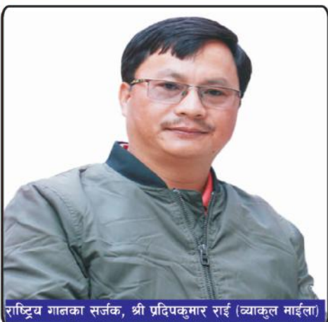
राष्ट्रिय गानका सर्जक, श्री प्रदिपकुमार राई (व्याकुल माईला)