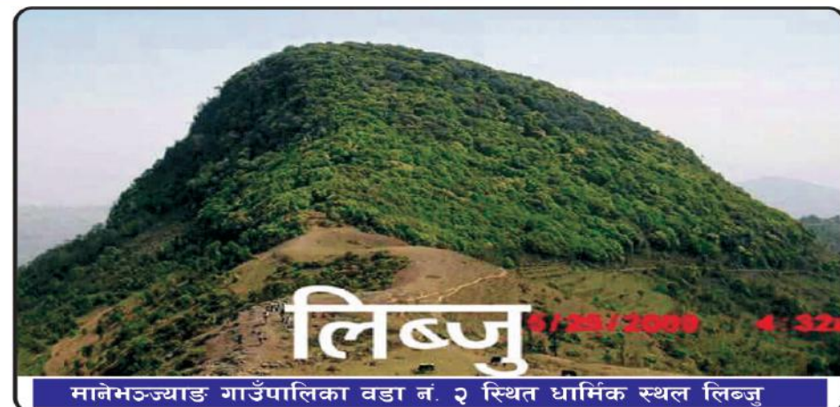
मानेभञ्ज्याङ गाउँपालिका वडा नं. २ स्थित धार्मिक स्थल लिब्जु