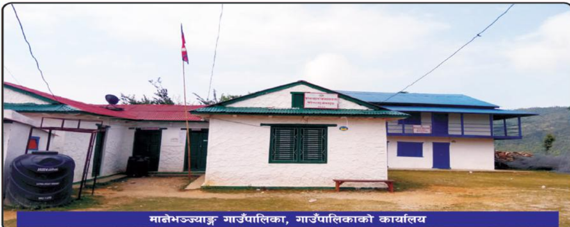
मानेभञ्ज्याङ गाउँपालिका, गाउँपालिकाको कार्यालय